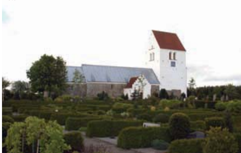
Jetsmark Kirke: Jetsmark Kirke og den gamle kirkegård har et flot og markant udtryk. Her ses kirken fra nord.