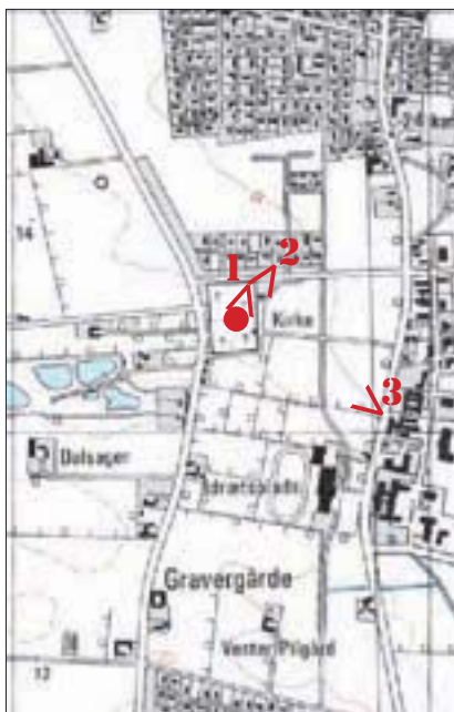
Kortet viser Jetsmark Kirke, markeret med rødt samt fotovinkler.

Jetsmark Kirke er en flot og anelig kirke. Den har romansk apsis, kor og skib, og sengotiske tilbygninger i form af tårn mod vest og våbenhus uden for norddøren. De romanske bygninger er opført i granitkvadre, mens de senere tilbygninger fremstår som hvidkalket mursten og rødt tegltag. Kirkegårdsanlægget består af en gammel kirkegård omkring kirken og en ny kirkegård fra 1991 lige øst herfor. Begge kirkegårde afgrænses af et stendige, der flere steder er suppleret med træer eller hæk. Udtryksmæssigt er kirkegårdene meget forskellige, idet den nye kirkegård er indrettet som et intimt parkmiljø med en god blanding af træer og buske. Den gamle kirkegård markerer sig ved, at de tre største stier er understreget af allétræer. Det er de eneste høje træer på selve kirkegården, og de giver kirkegården et markant udtryk.