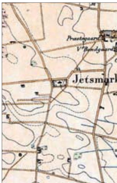
Historisk kort fra 1878-1887, der viser gamle strukturer i landskabet. Sammenholdt med det nutidige kort ovenfor ses områdets udvikling. Kortet viser desuden tydeligt det omgivende landskabs terrænerformer.