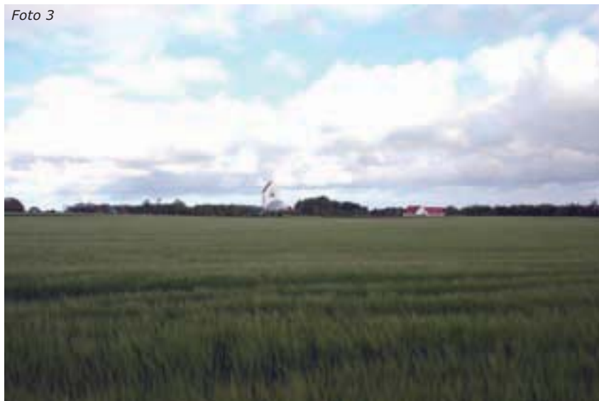
Jetsmark Kirke - fjernområde: Jetsmark Kirke har stor visuel betydning for landskabsbilledet set fra syd og øst, hvor kirken er markant.