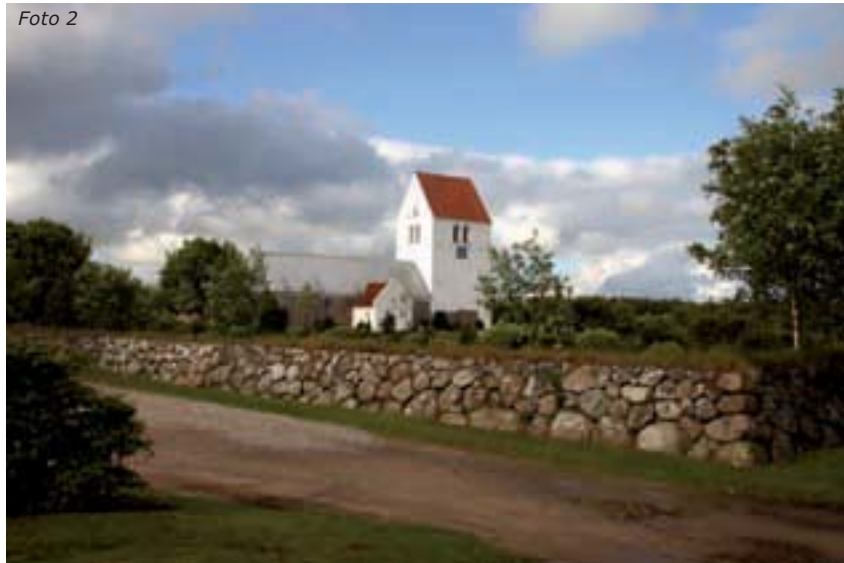
Jetsmark Kirke - nærmiljø: Jetsmark Kirke set fra vejen nord for kirken. Det åbne miljø omkring kirken giver den visuel betydning for nærmiljøet.